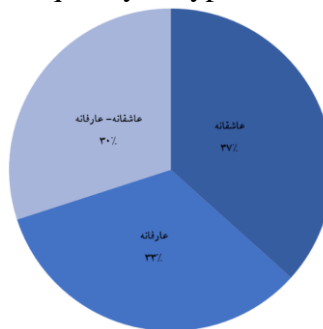
شکل ۳- بسامد انواع مضامین غیر اجتماعی